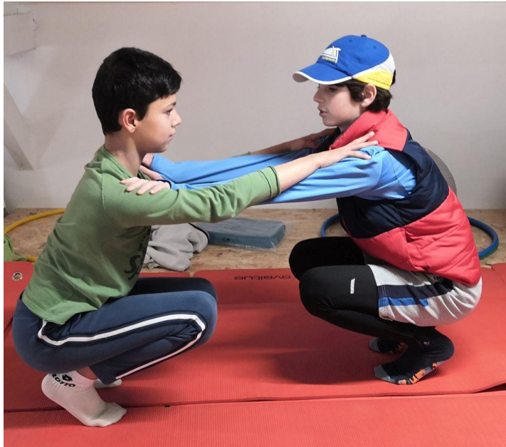
Stage d'aviron pendant les vacances de la Toussaint 2023